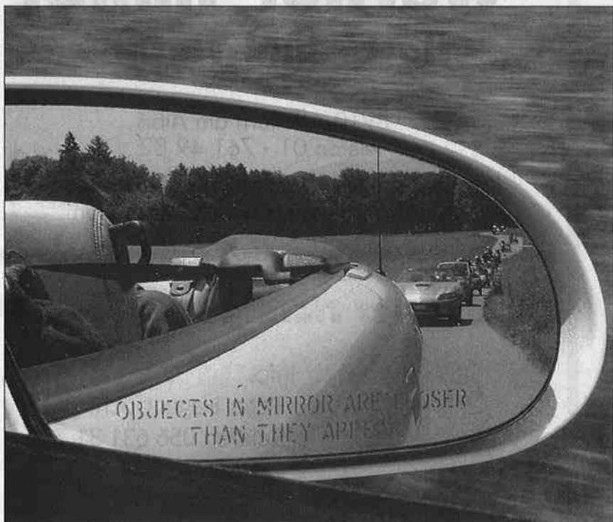
Unterwegs über den Islisberg.